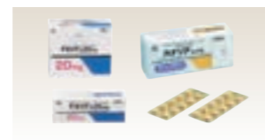
テネリア・カナリア(日本)