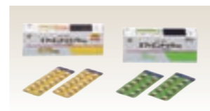
エフィエント(日本)