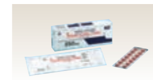
ゲフィチニブ(ジェネリック医薬品)