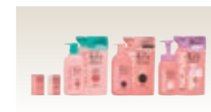
ミノン(OTC医薬品関連)