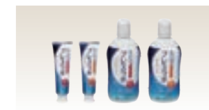
プレスラボ(OTC医薬品関連)