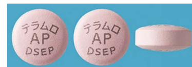
表 裏 側面