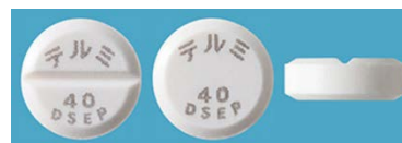
表 裏 側面