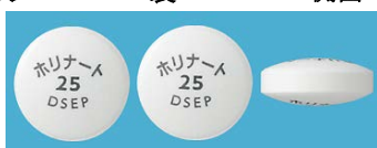
表 裏 側面