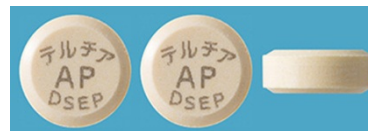
表 裏 側面