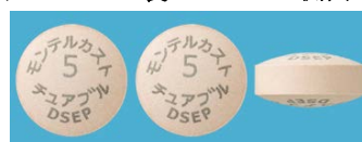
表 裏 側面