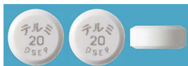
表 裏 側面