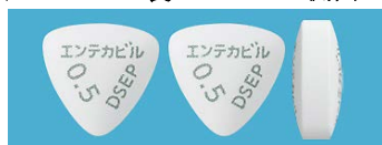
表 裏 側面