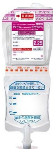
<タゾピペ配合点滴静注用バッグ 2.25 「DSEP」 >