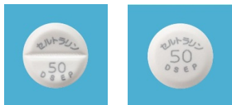
<セルトリン錠 50mg 「DSEP」 >