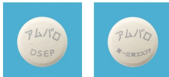
<アムパロ配合錠 「DSEP」 >