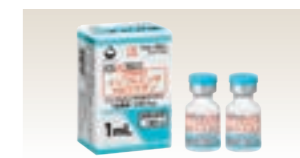
インフルエンザHAワクチン(ワクチン)