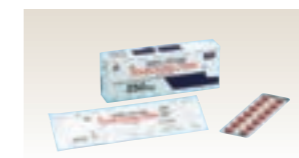
ゲフィチニブ(ジェネリック医薬品)