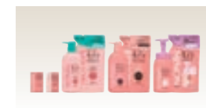
ミノン(OTC医薬品関連)