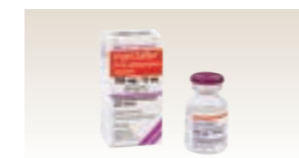
インジェクタファー(米国)