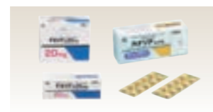
テネリア・カナリア(日本)