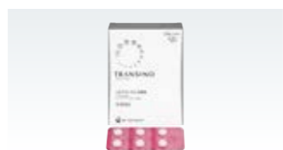
トランシーノ (OTC 医薬品関連)