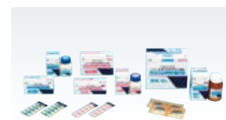
レボフロキサシン (ジェネリック医薬品)