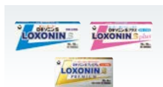
ロキソニン S (OTC 医薬品関連)