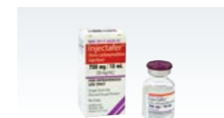
インジェクタファー (米国)