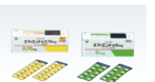
エフィエント (日本)