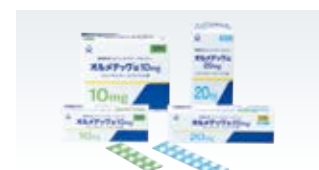
オルメテック (日本)