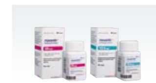
モバンティック (米国)